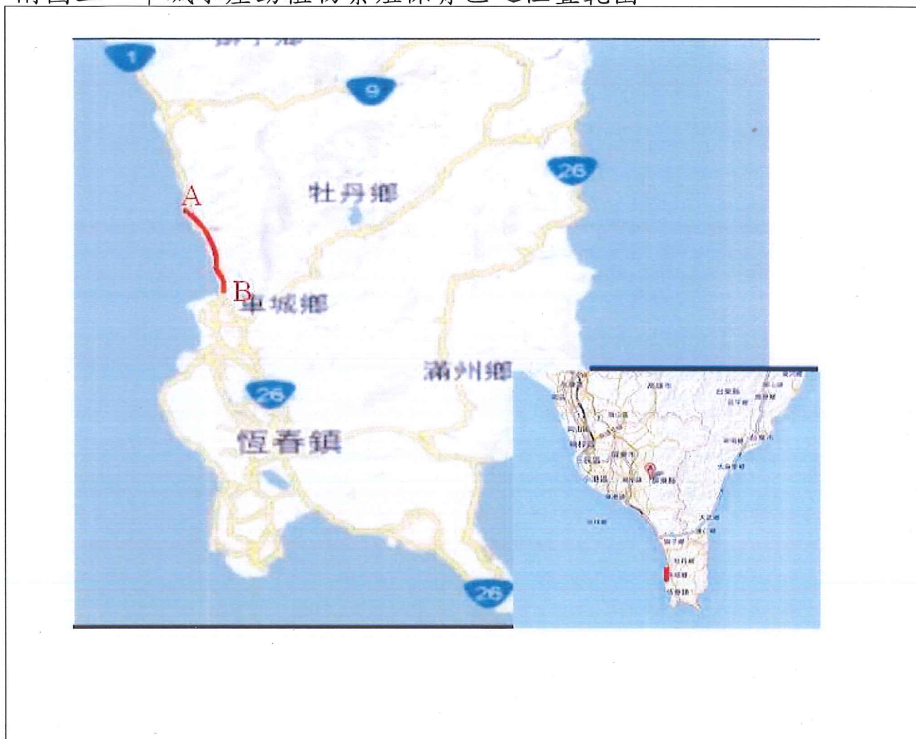
附表三、車城水產動植物繁殖保育區之座標