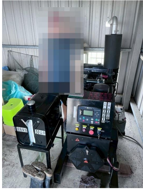
驗收照片-申請人與設備合照