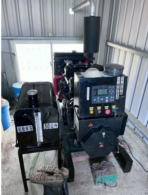
驗收照片-設備整體