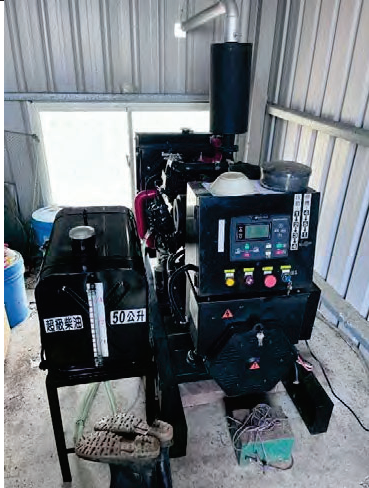
驗收照片-設備整體