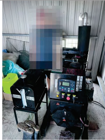
驗收照片-申請人與設備合照