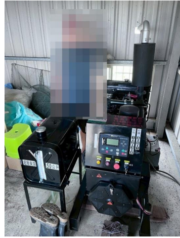
驗收照片-申請人與設備合照