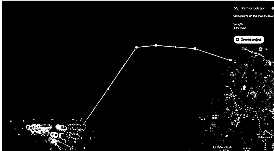
圖 2 - 預計航行路線 The Passage Plan

All vessels mobilized in this project will use Taichung Port as their working ports. In case of emergency or weather impact, Taichung Port will also be considered as emergency shelter ports.