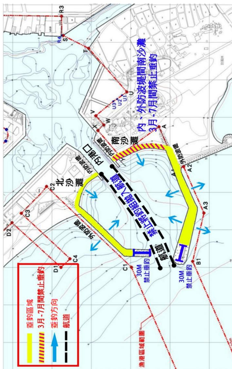
附圖四、安平漁港垂釣區