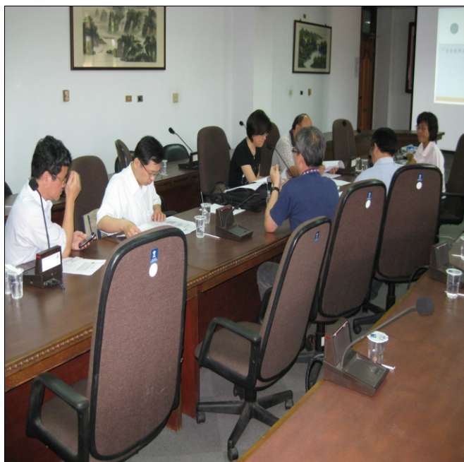
照片一、計畫執行單位向查證小組進行計畫內容簡報。