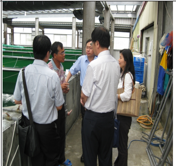
照片三、查證人員至宜蘭縣養殖漁業發展協會實地查證情形。