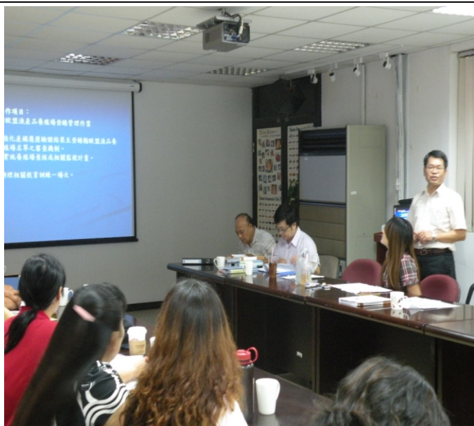
照片五、受查單位與查證人員答詢情形。