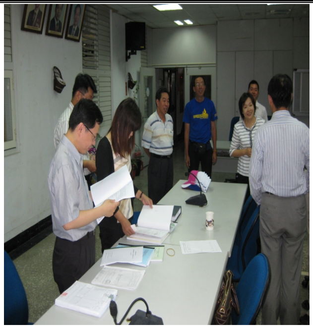
照片二、查證小組與受查單位進行計畫執行討論。