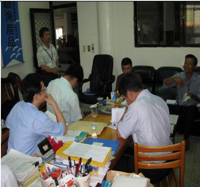
照片二、查證小組與受查單位討論計畫執行情形。