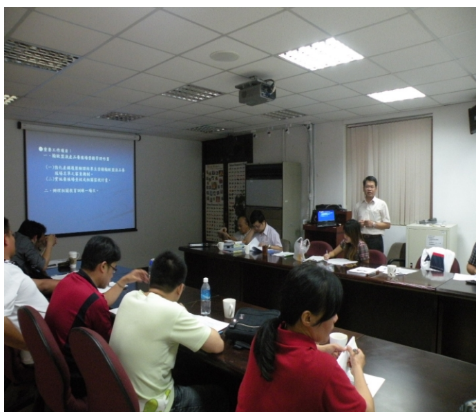
照片一、計畫執行單位向查證小組人員進行計畫內容簡報。