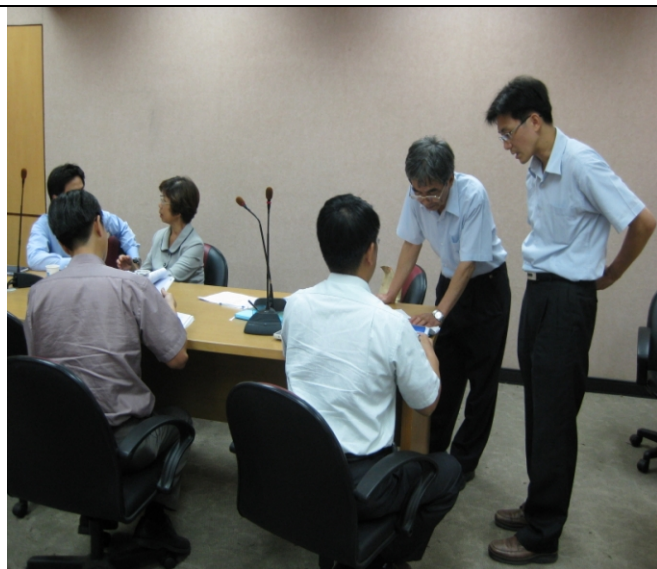
照片三、查證人員詢問計畫執行情形。