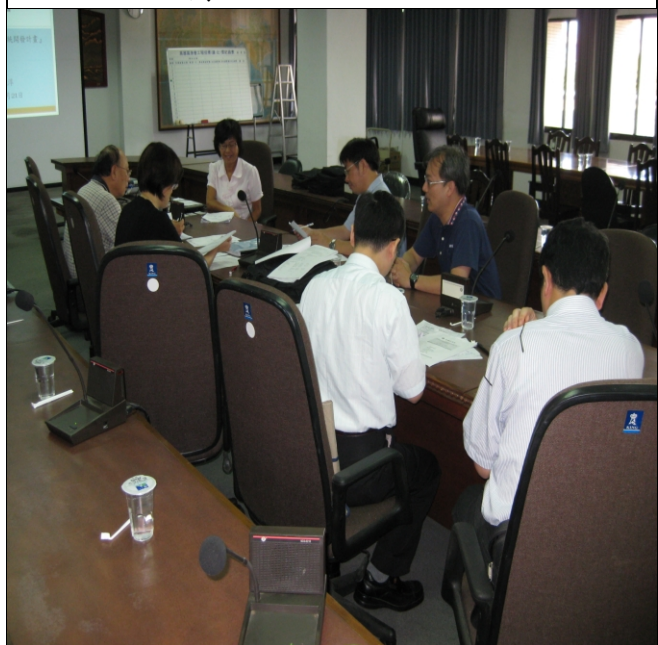
照片三、查證小組人員與受查單位答詢情形。