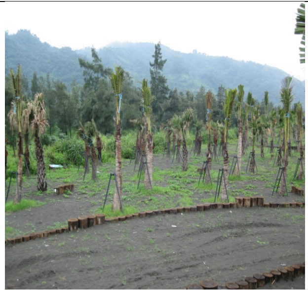
照片四、本案在外澳沙灘綠美化工程植栽情形。