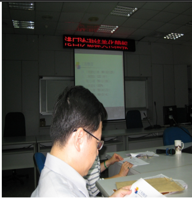
照片一、計畫執行單位向查證小組人員進行計畫內容簡報。。