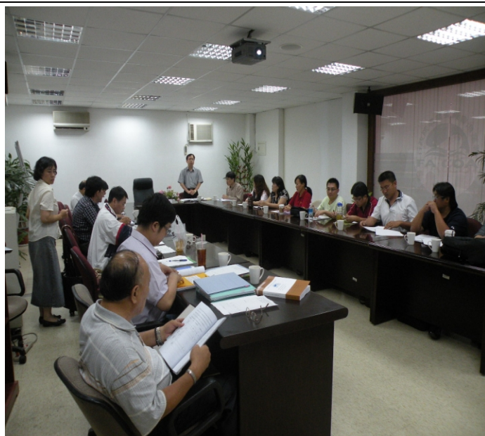
照片六、查證人員查核契約、經費支出及憑證資料。