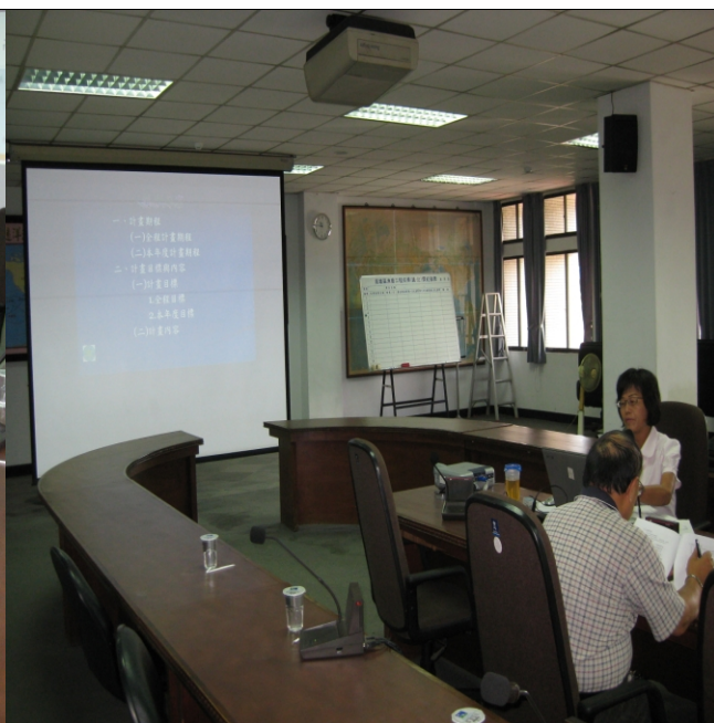
照片二、計畫執行單位向查證小組進行計畫內容簡報。