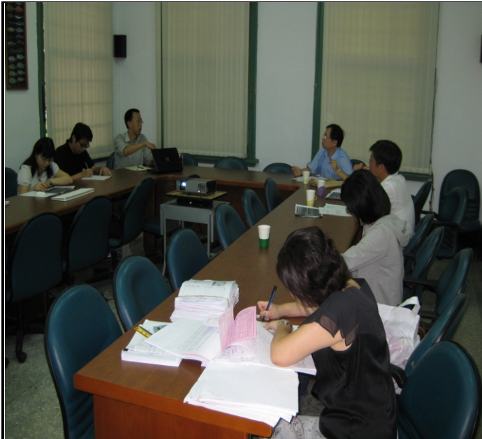
照片三、查證小組計畫查證情形。