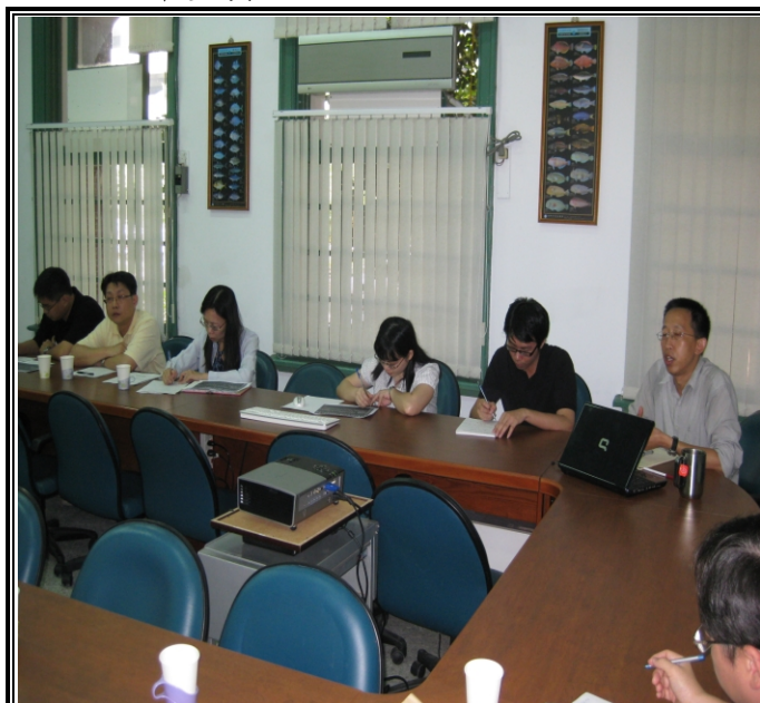
照片一、計畫執行單位向查證小組進行計畫內容簡報。