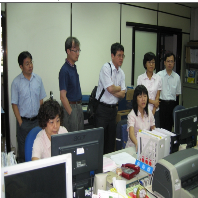
照片四、查證小組人員查核資訊系統建置情形。