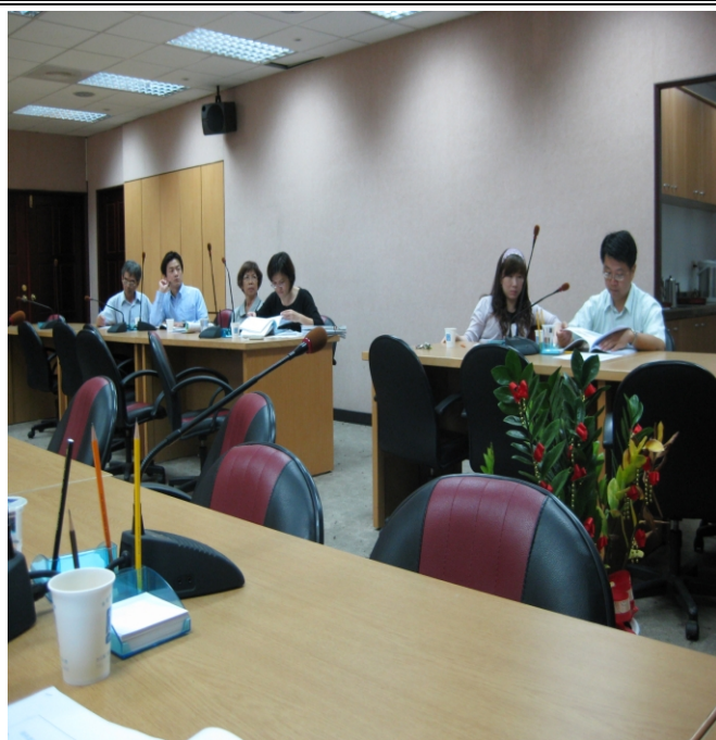
照片二、查證人員查證計畫相關資料情形。