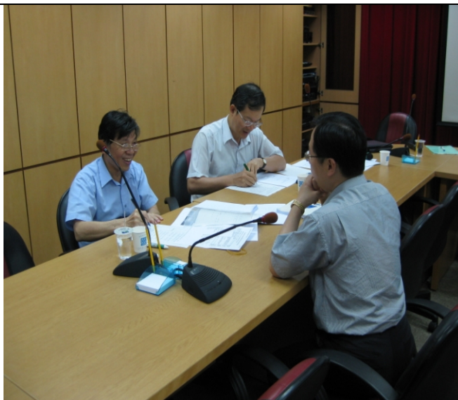
照片四、查證人員討論計畫查證情形。