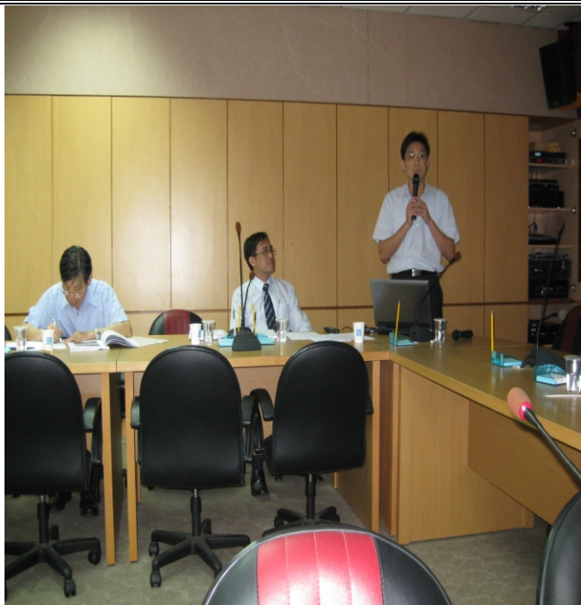
照片一、計畫執行單位向查證小組人員進行計畫內容簡報。