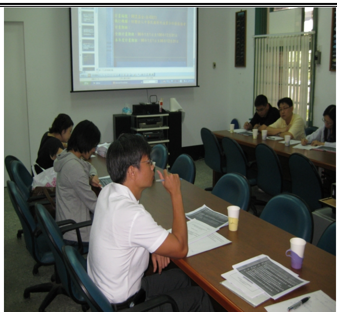
照片二、查證小組與受查單位進行討論情形。