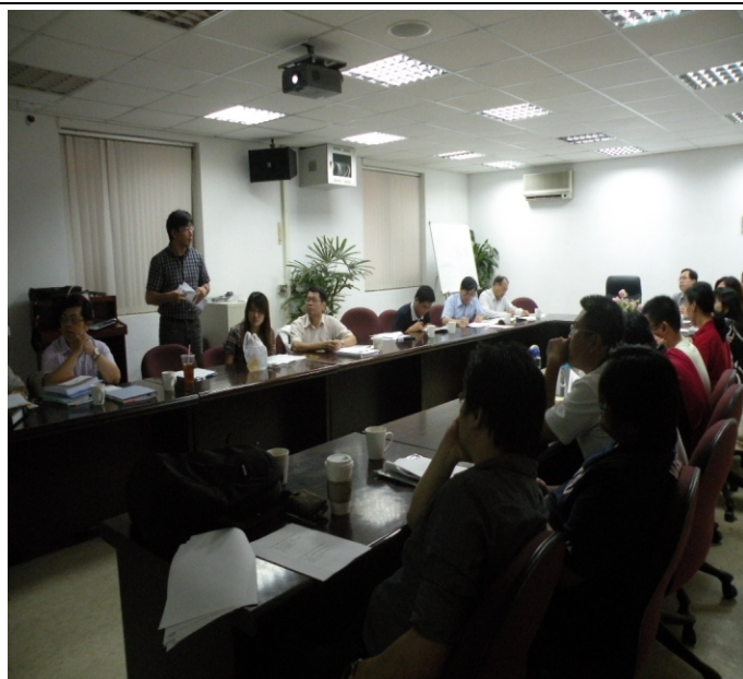
照片二、查證人員詢問計畫執行情形。