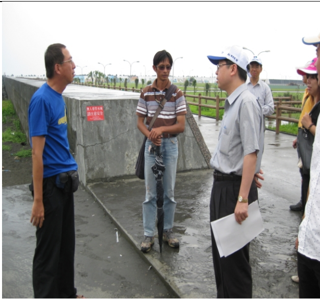
照片三、查證小組人員查證本案綠美化工程植栽情形。。