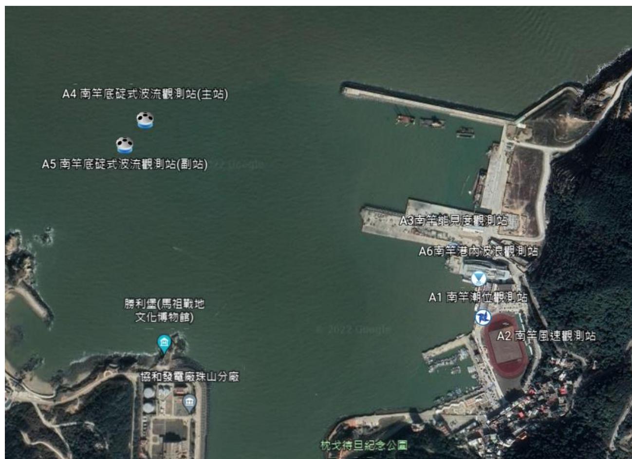
圖 1 南竿鄉福澳港海氣象儀器設備位置示意圖