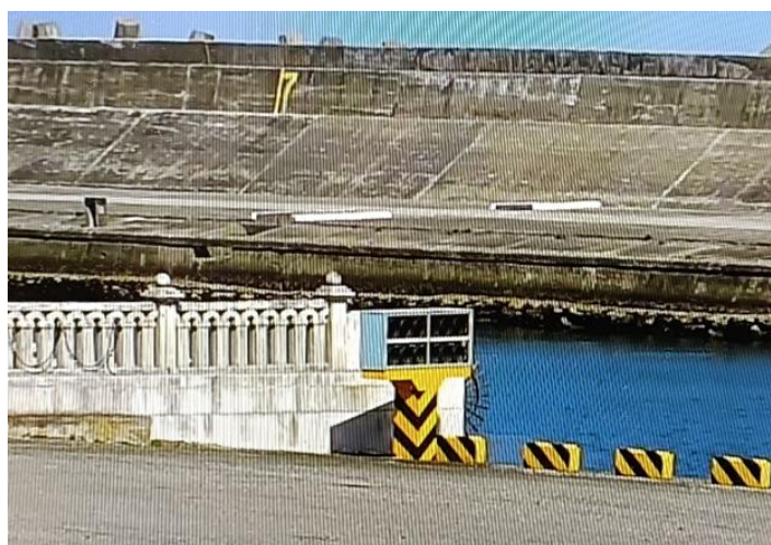
圖 2 - #17 碼頭南端航道警示燈號