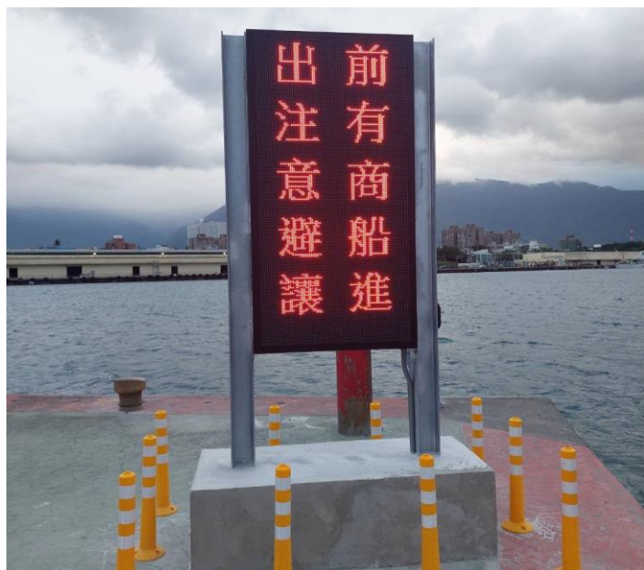
圖 4 - 漁港堤口警示燈牌