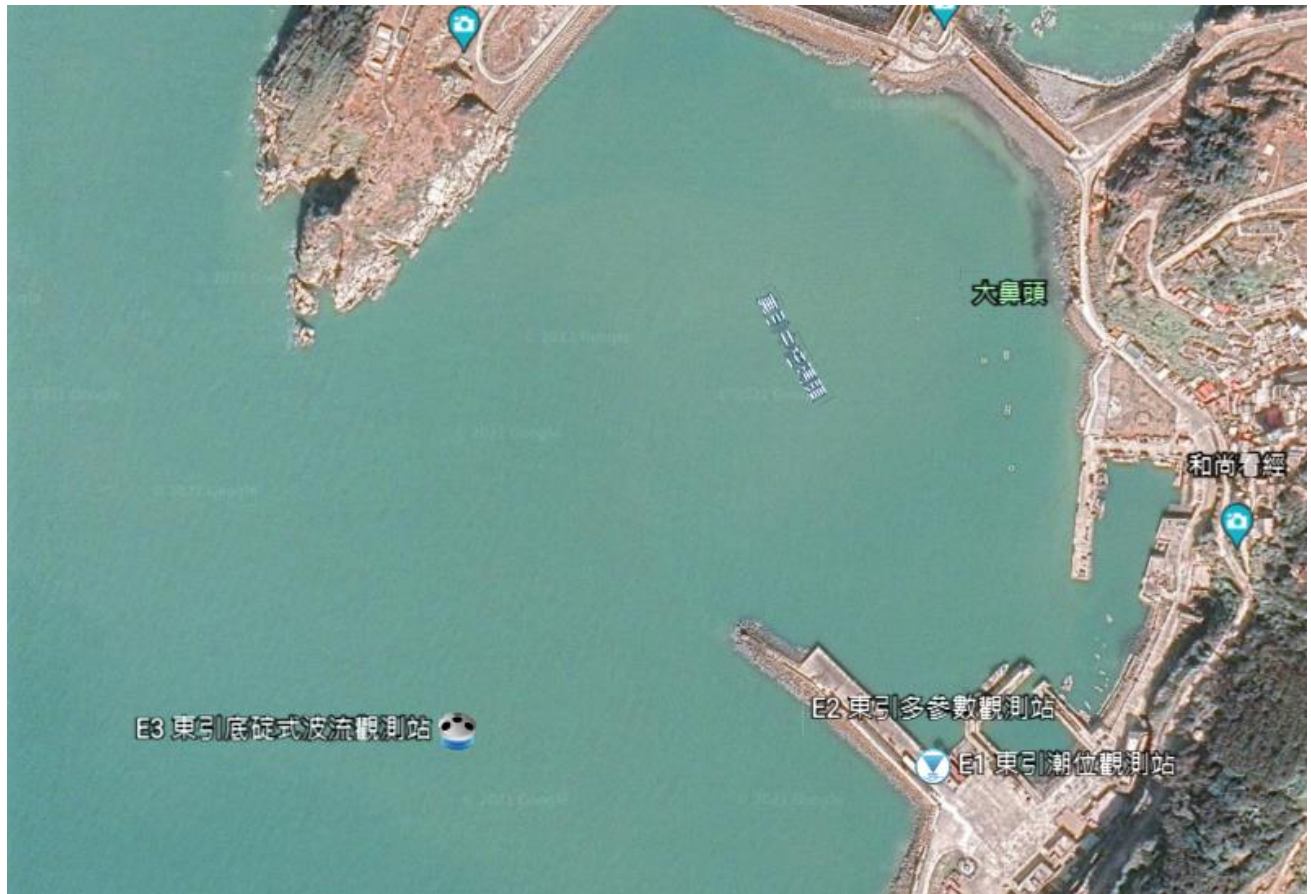
圖 3 東引鄉海氣象儀器設備位置示意圖