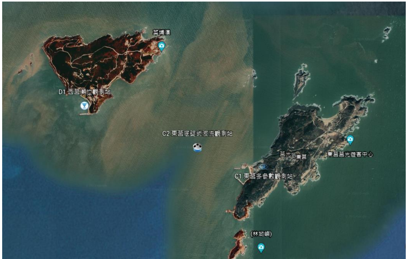
圖 2 莒光鄉海氣象儀器設備位置示意圖