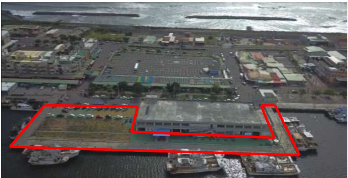
圖 2 計畫範圍