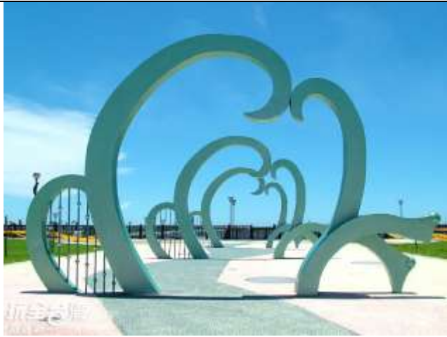
圖 6 興達港情人碼頭