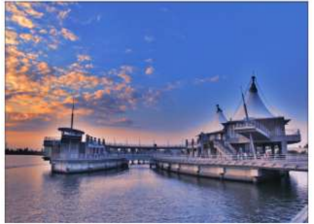
圖 7 興達港海上劇場 1