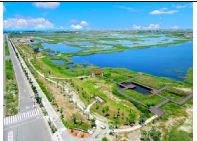
圖 5 茄萣濕地公園