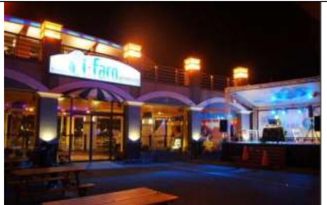
圖 9 興達港海景餐庭