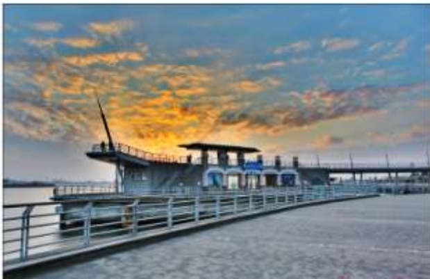
圖 8 興達港海上劇場 2