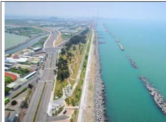
圖 4 茄萣海岸線