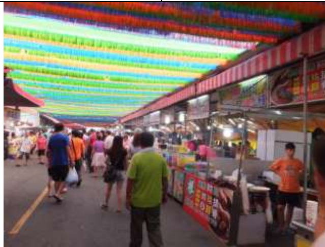
圖 10 大發路觀光魚市