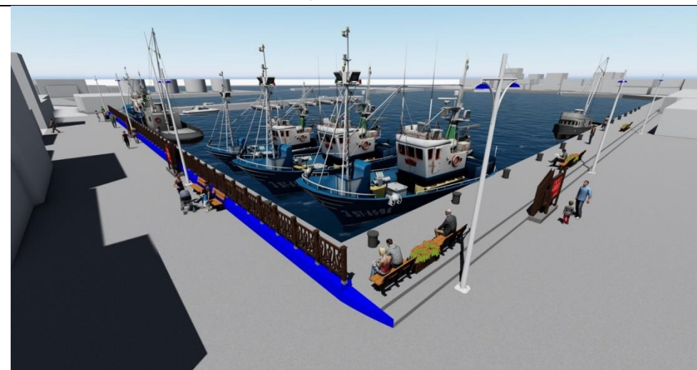
圖 15 本計畫構想示意圖四