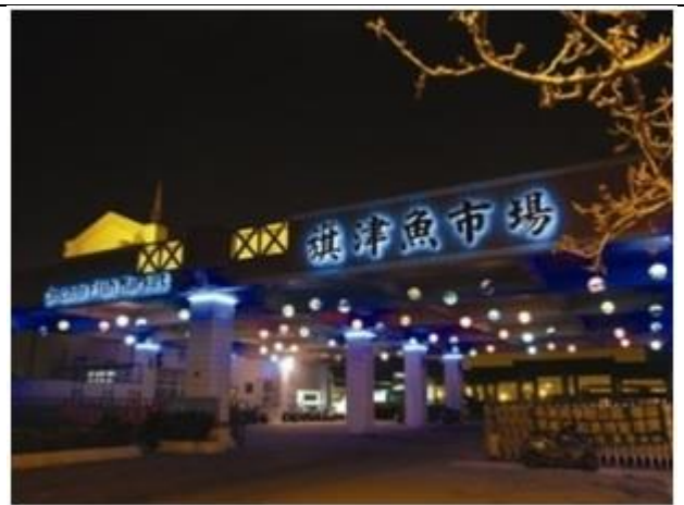
圖 8 旗津魚市場