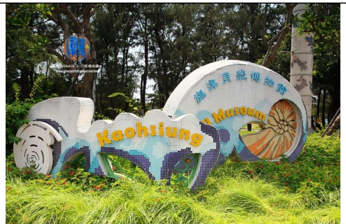
圖 10 旗津貝殼博物館