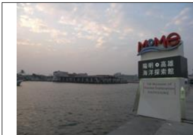
圖 5 高雄陽明海洋探索館