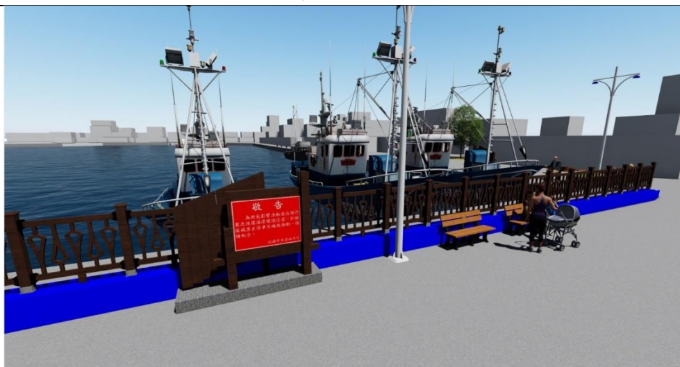
圖 13 本計畫構想示意圖二