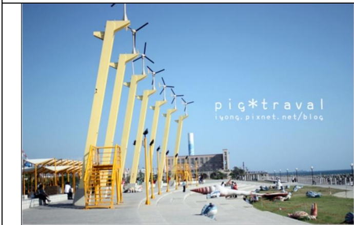
圖 9 旗津風車公園