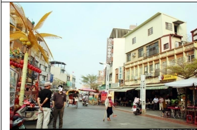
圖 11 旗津老街