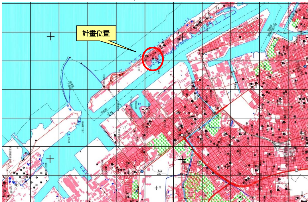
圖 2 計畫位置(經建版地圖)