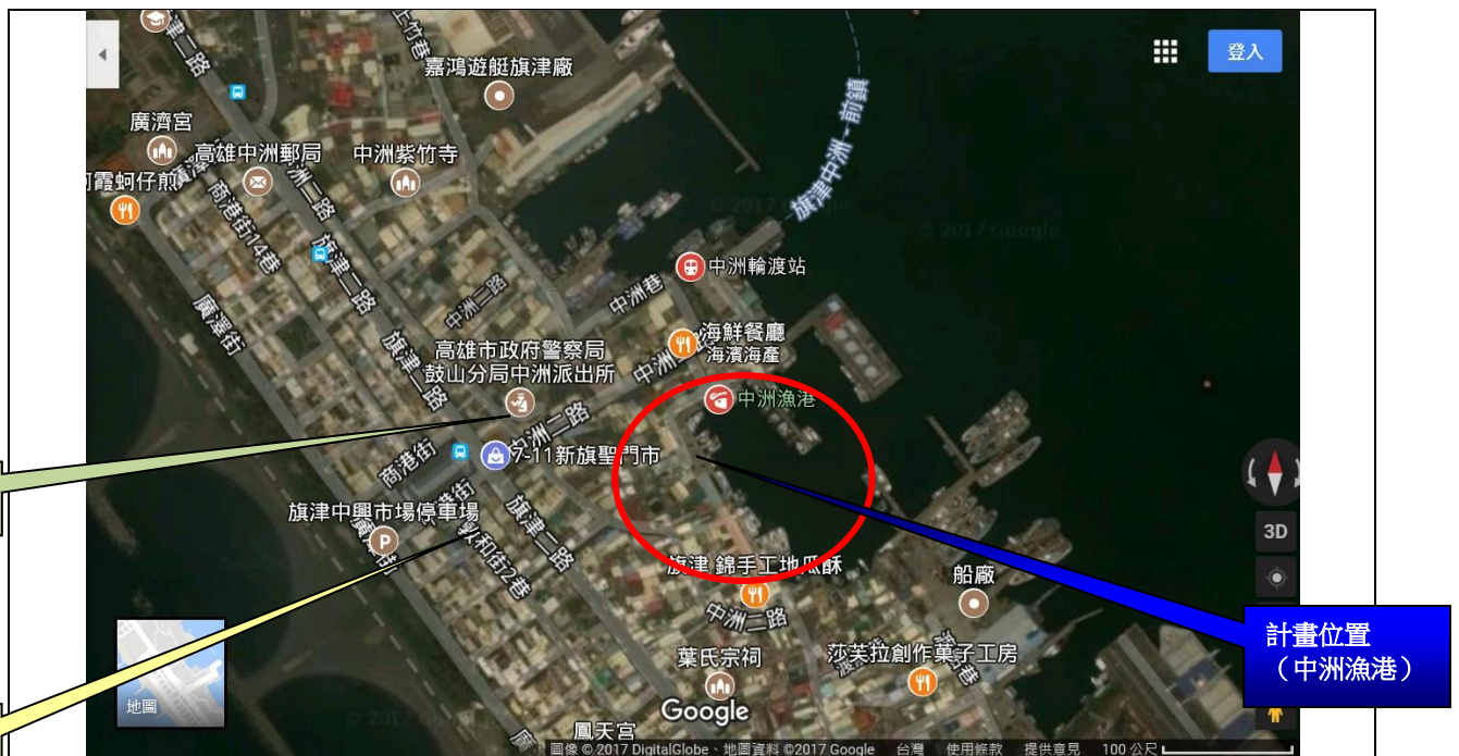
圖 1 計畫位置(航照圖)