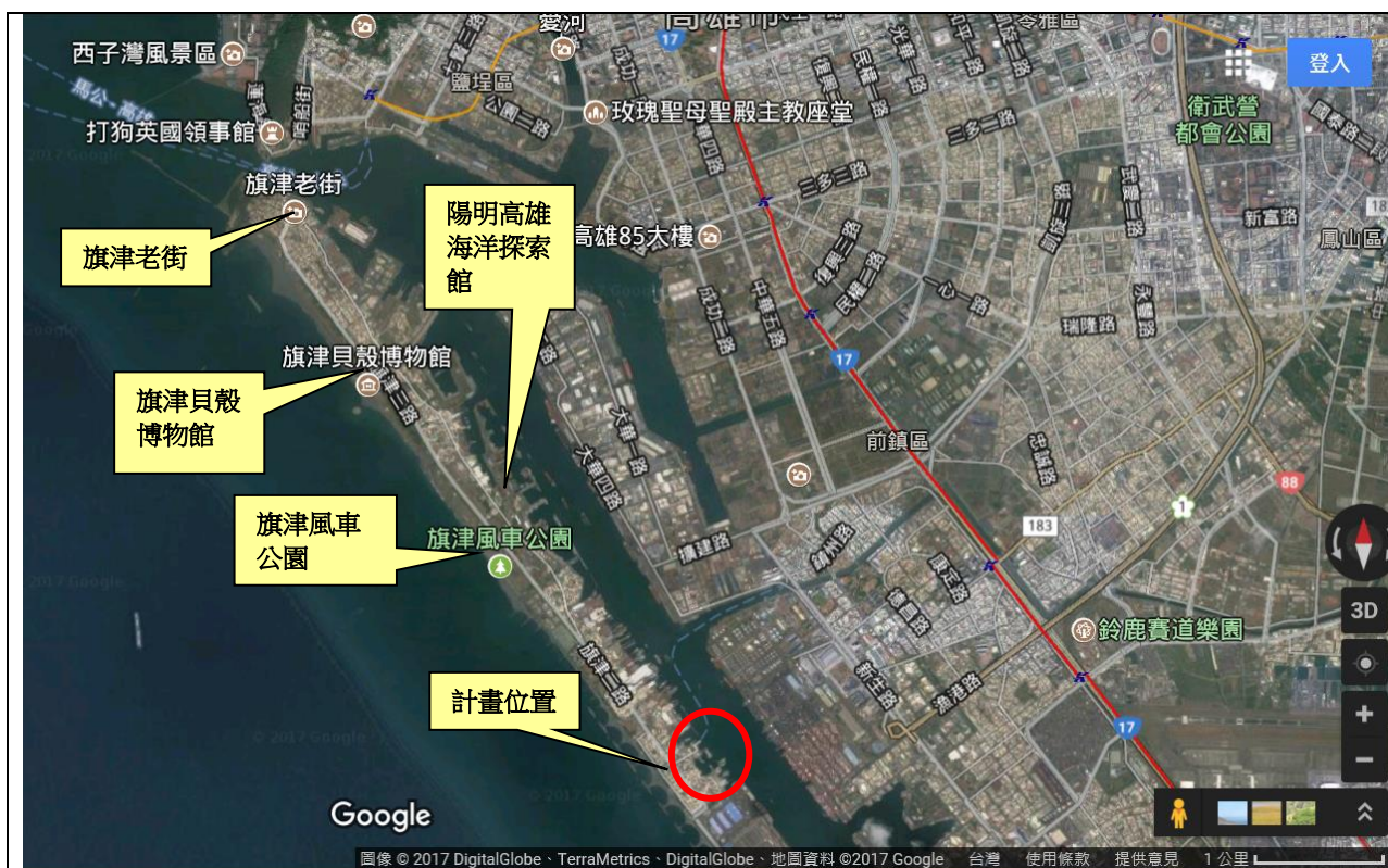
圖 4 計畫位置周邊景點