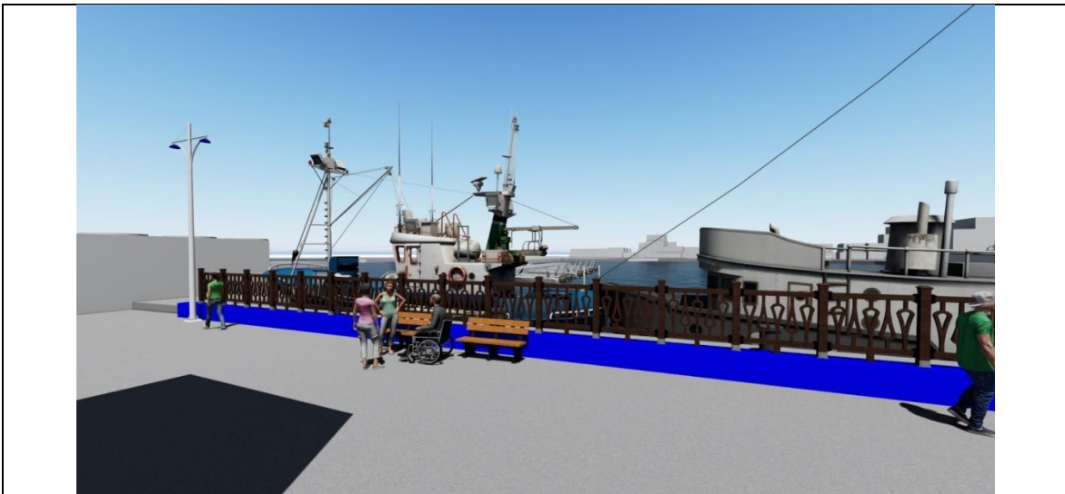
圖 16 本計畫構想示意圖五