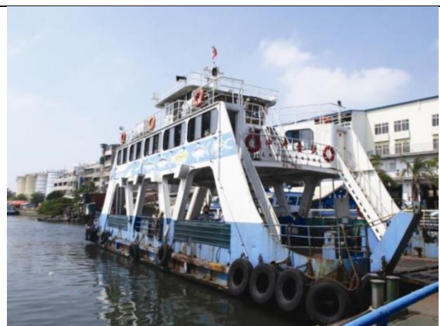
圖 6 中洲渡輪站