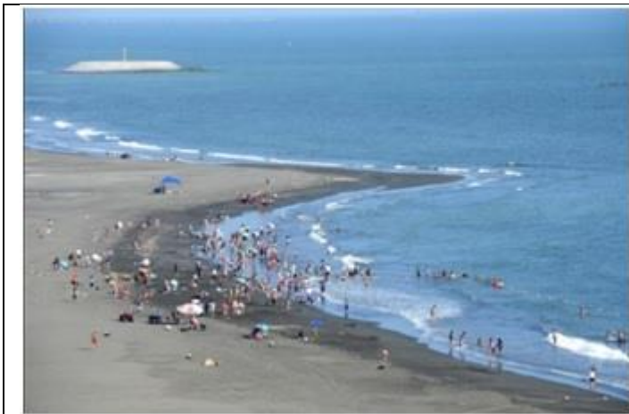
圖 7 旗津海灘