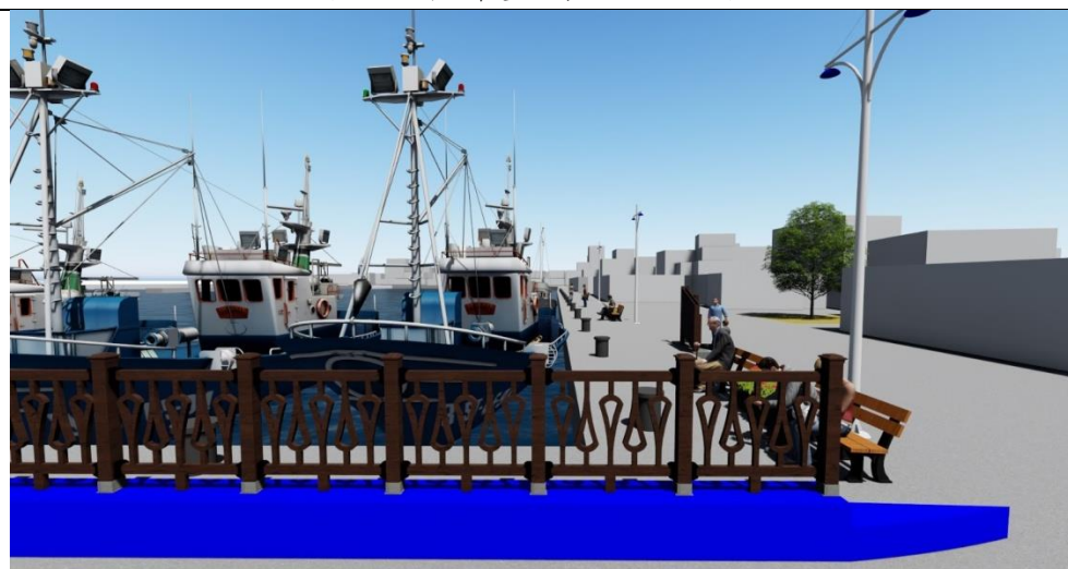
圖 14 本計畫構想示意圖三